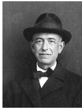
Manuel de Falla

brujo» erzählt die Sängerin, wie sie die Geister der Vergangenheit in einer danza ritual del fuego loswird. Durch dieses glühende Feuertanz-Ritual — auch musikalisch die berühmteste Nummer des Werks — wird erst der Weg frei für die wahre Liebe. Diese magische Kraft geht nicht nur von der Musik de Fallas und Piazzollas aus; auch in ihr selbst scheinen die verschiedenen musikalischen Einflüsse sich gegenseitig in vibrierenden Liebeszauber zu bannen.