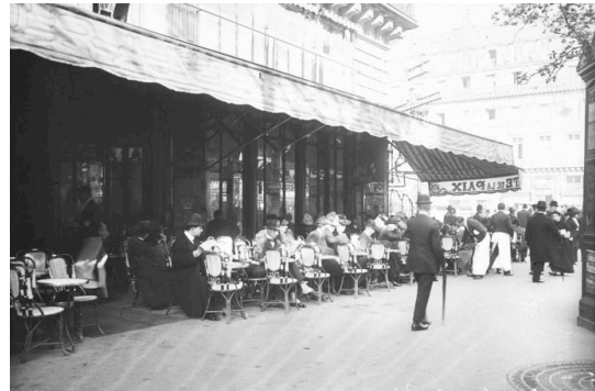
Das noble Pariser Café de la Paix um 1911

De Falla wirkte zwar in Madrid, wo 1915 «El amor brujo» uraufgeführt wurde. Bis zum Ausbruch des 1. Weltkriegs hatte er aber sieben Jahre lang in Paris gelebt, wo er den Rat von Debussy suchte, von Paul Dukas gefördert wurde, mit Strawinsky, Ravel und anderen wichtigen Persönlichkeiten des Musiklebens bekannt war und eben noch mit seinen «Siete canciones populares españolas» seinen bislang grössten Erfolg gefeiert hatte. Während Komponisten und Publikum in Paris de Falla für das Spanisch-Exotische seiner Musik verehrten, kritisierten ihn spanische Kritiker in Madrid als «französisch verdorben»: «Volksmusik» war zu einer nationalen Frage geworden. Auch de Falla organisierte zwar in den Jahren darauf mit seinem Dichterfreund García Lorca Flamenco-Wettbewerbe. Seine eigene Musik jedoch blieb eine europäische.